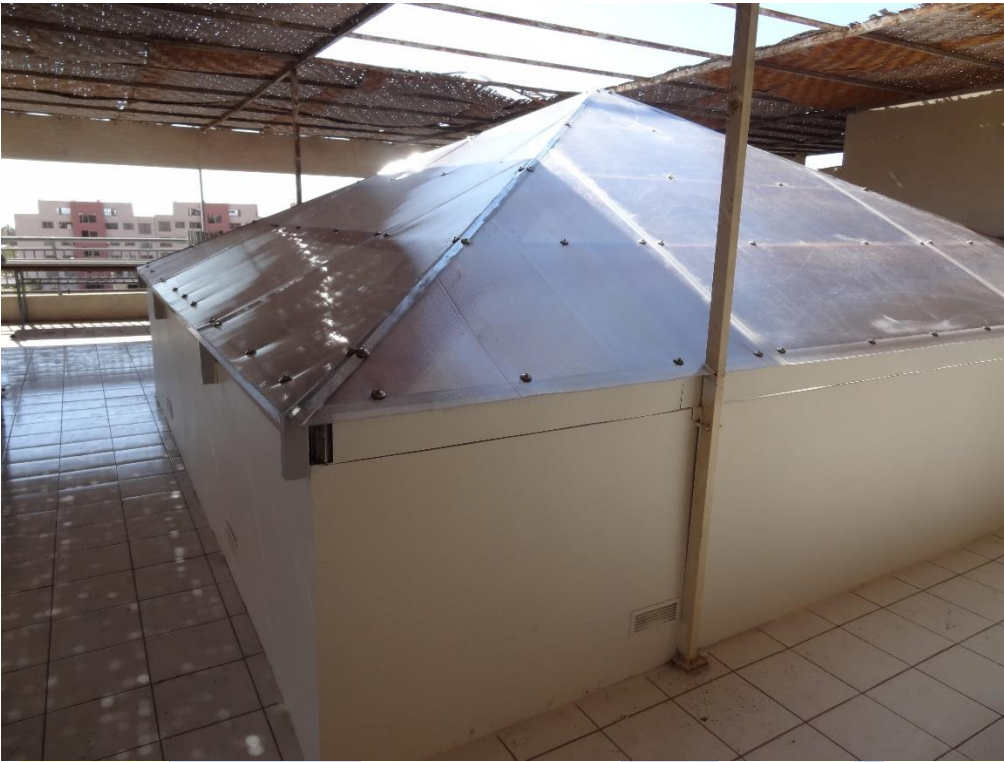
Recuperación Escotillas, tapas y escala sala Bombas}